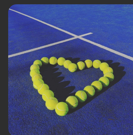
Love Padel Tour