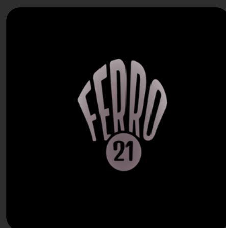
Enoteca Ferro 21