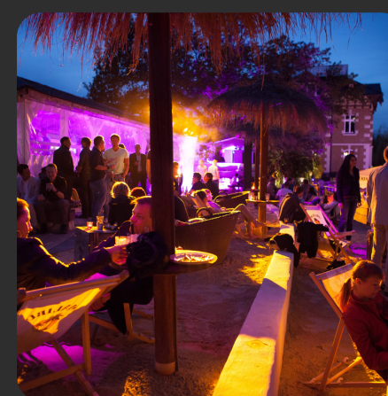
Roma Top Events