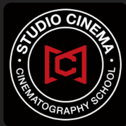
studio cinema international